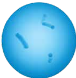
CLARION 25 CON MICROBAN

La tecnología Microban en Clarion 25 proporciona una capa adicional de protección por encima de la limpieza y desinfección regulares. Reduce la biocarga en los pisos al prevenir la colonización y multiplicación de las bacterias. Al final, con Clarion 25, usted puede estar tranquilo mientras los estudiantes estudian en un ambiente más limpio.