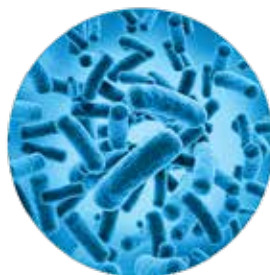
ACABADO PARA PISOS COMPETITIVO